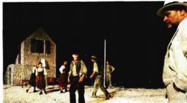
Glumački ansambl besprijeekorno funkcionira